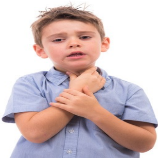
...le duele la garganta