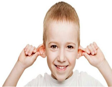
le duelen las orejas