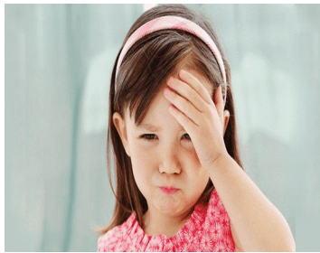
...le duele la cabeza.

2.- Le vamos a agregar dificultad; debes incorporar la mímica de cada cosa que le duele al burro.