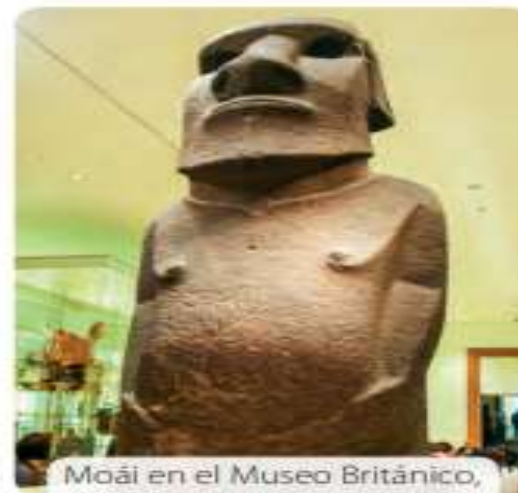
Moái en el Museo Británico, Inglaterra.