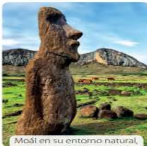
Moái en su entorno natural, la isla Rapa Nui.

Fuente: Paula Valles. Operación retorno: regresan piezas a Rapa Nui . latercera.com . (Fragmento adaptado).