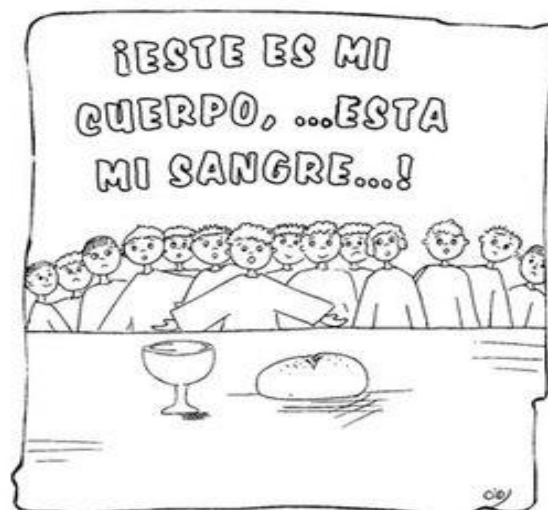
JUEVES SANTO: LA ULTIMA CENA