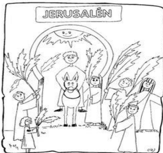
DOMINGO DE RAMOS