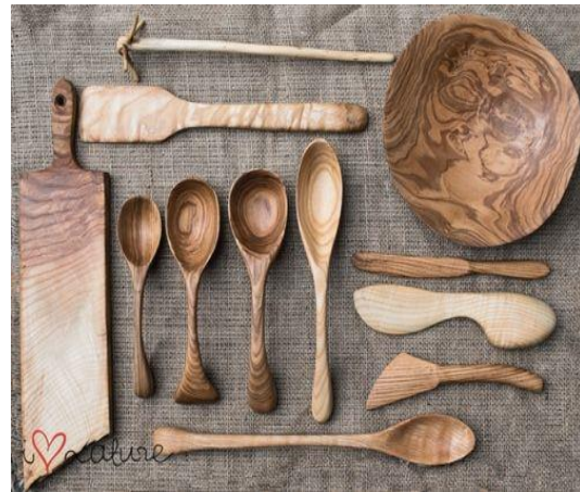
Utensilios de cocina antiguos