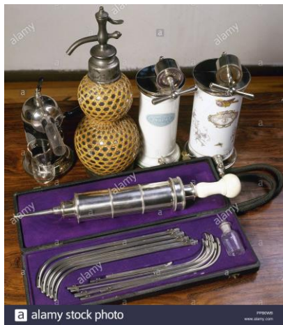
Instrumentos médicos antiguos