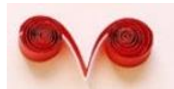
Rollo en V