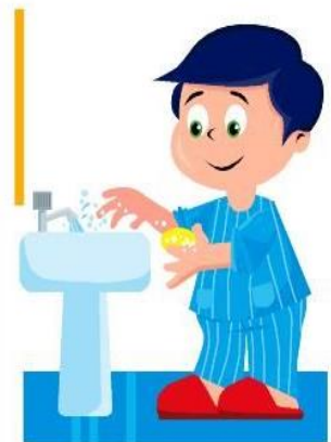
Lavarse las manos