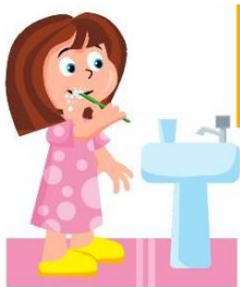
Lavarse los dientes

1) Encierra en un círculo solo las imágenes dónde los niños se preocupan de su higiene personal